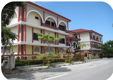
Mahkamah Rendah Syariah Parit Buntar