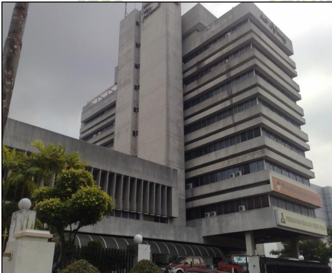
BANGUNAN WISMA WAN MOHAMAD

Kemudian berpindah ke sebuah banglo yang kemudiannya kini menjadi Pejabat Daerah dan Tanah Kinta.