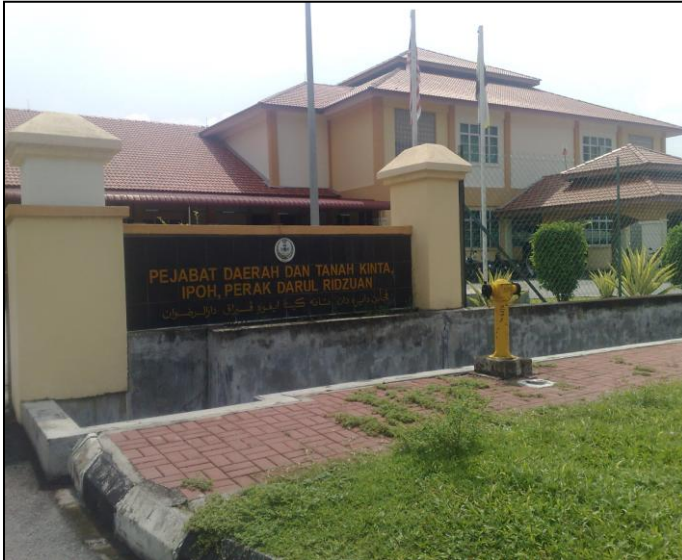
PEJABAT DAERAH DAN TANAH KINTA

Kemudian berpindah ke sebuah banglo yang kemudiannya kini menjadi Pejabat Daerah dan Tanah Kinta.