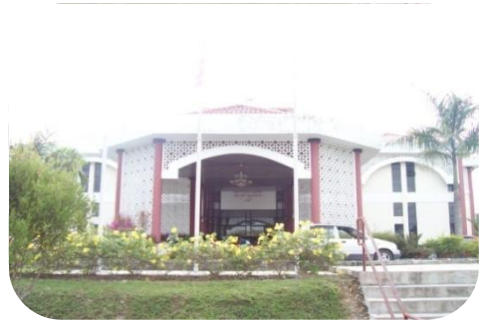
Mahkamah Rendah Syariah Gerik