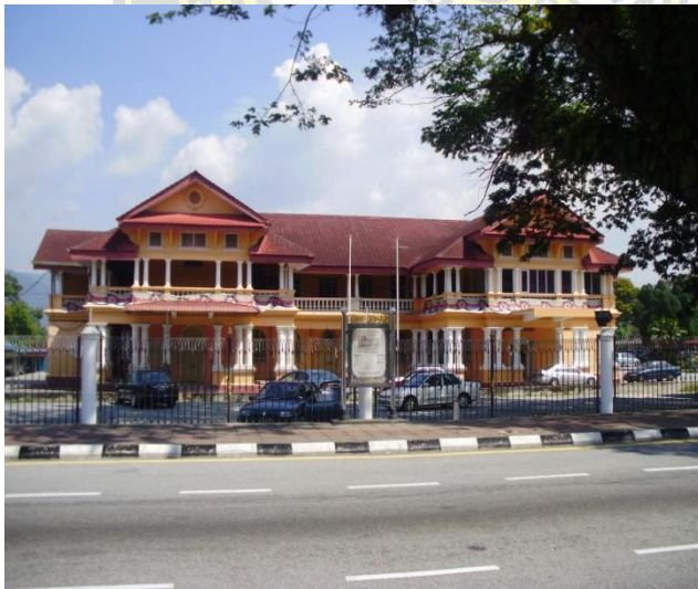
TAPAK BANGUNAN MAJLIS KESELAMATAN NEGARA

Setelah kemangkatan baginda Sultan Abdul Aziz Al-Mu'tasim Billah Shah pada 29 Mac 1948, takhta kerajaan Negeri Perak diwarisi oleh Duli Yang Maha Mulia Sultan Yussuf Izzudin Shah Ghafarullahulah Ibni Al-Marhum Sultan Abdul Jalil Nasiruddin Al-Mukhataram Karamatullah Shah. Pada masa pemerintahan Baginda Sultan Yussuf Izzudin Shah inilah, maka kerajaan negeri secara rasmi menubuhkan Majlis Agama Islam Dan Adat Melayu Perak dan Jabatan Hal Ehwal Agama Islam Perak pada 1 Muharram 1369 Hijrah Bersamaan 23 Oktober 1949. Maka dengan penubuhan Majlis Agama Islam Dan Adat Melayu Perak, Pentadbiran Balai Syara' dan Komuniti Quran Perak ini yang berada di Kuala Kangsar telah disatukan di bawah Majlis Agama Islam Dan Adat Melayu Perak dipindahkan ke Ipoh.