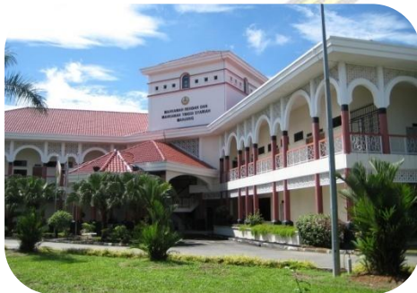
Mahkamah Rendah Syariah Manjung