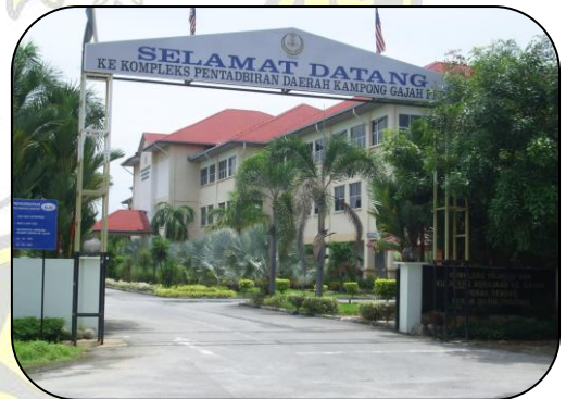
Mahkamah Rendah Syariah Seri Iskandar