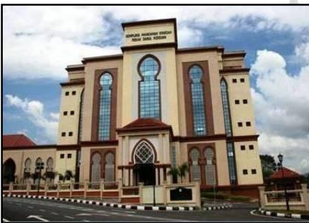
Mahkamah Tinggi Syariah Ipoh di Aras 5 dan Mahkamah Rendah Syariah di Aras 1