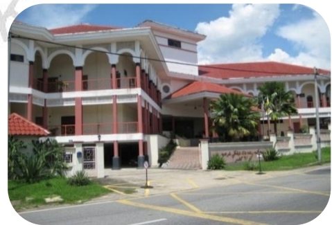
Mahkamah Rendah Syariah Kuala Kangsar