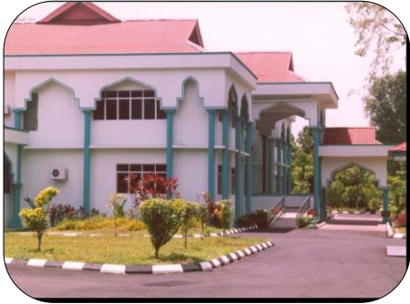
Mahkamah Rendah Syariah Taiping