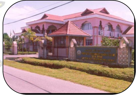
Mahkamah Rendah Syariah Teluk Intan