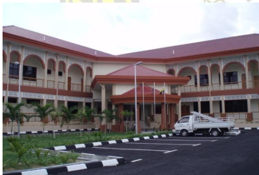
Mahkamah Rendah Syariah Tapah