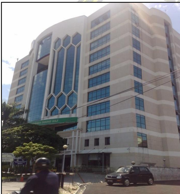
BANGUNAN LEMBAGA TABUNG HAJI IPOH

Mulai 1 Mei 1995 Mahkamah Syariah telah dipisahkan daripada pengurusan Jabatan Agama Islam Perak dan mempunyai pentadbirannya sendiri. Jabatan ini diketuai oleh Yang Amat Arif Ketua Hakim Syarie selaku ketua Hakim-hakim Syarie dan Ketua Jabatan Kehakiman Syariah Perak. Di bawah pentadbirannya terdapat 2 orang Yang Arif Hakim Mahkamah Tinggi Syariah, seorang Ketua Pendaftar, 9 orang Hakim Mahkamah Rendah Syariah dan sejumlah kakitangan sokongan. Pada ketika itu Mahkamah masih dibangunan Jabatan Agama.