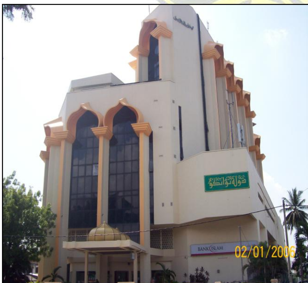
JABATAN AGAMA ISLAM PERAK

Enakmen ini juga menjelaskan Kadi, Kadi Besar dan Ahli Jawatankuasa hendaklah dilantik oleh Yang Maha Mulia Sultan. Bidangkuasa Kadi atau Kadi Besar tidak dijelas didalam mana-mana enakmen. Maka Mahkamah Kadi atau Kadi Besar adalah mempunyai bidangkuasa yang sama. Oleh itu, panggilan nama Mahkamah Kadi atau Kadi Besar lebih popular dengan nama Mahkamah Kadi berbanding Mahkamah Syariah.