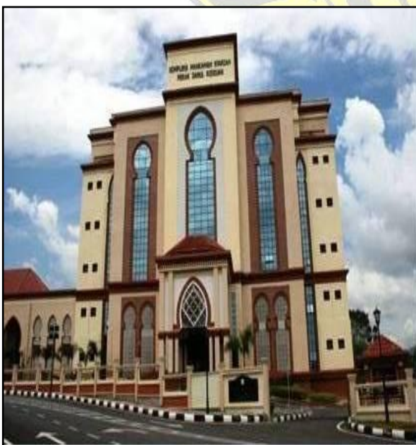
JABATAN KEHAKIMAN SYARIAH NEGERI PERAK

Mahkamah Syariah mempunyai bidangkuasa untuk mendengar, membicara dan membuat apa-apa keputusan didalam kes-kes Jenayah dan kes Mal.